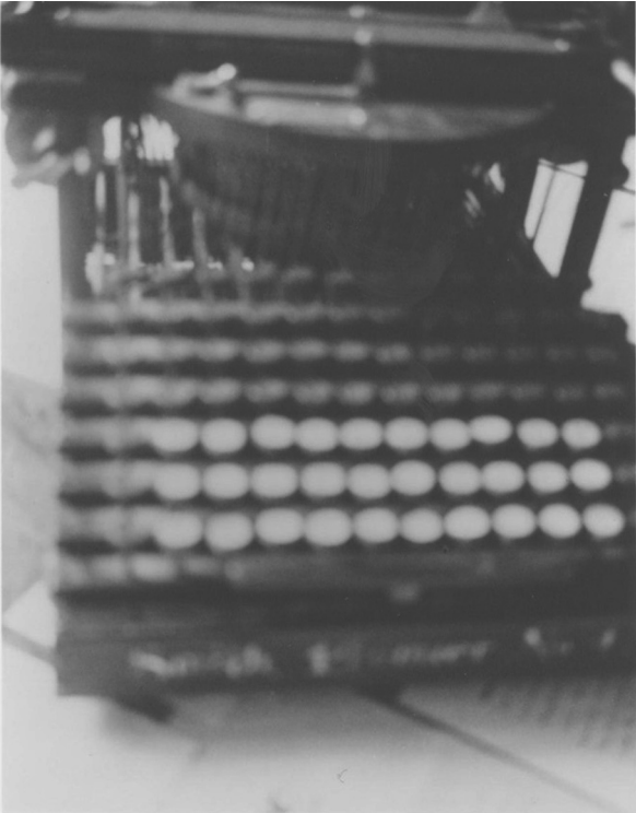
Hermann Hesse's typewriter, 2003.