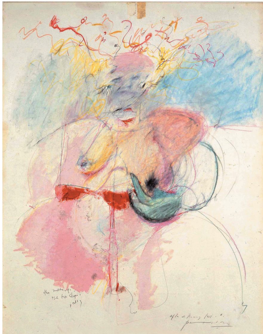
Alter de Kooning, 1968

Komisarioa / Comisariado: Laura Fernández Orgaz Kordinatzailea / Coordinación: Yolanda de Egoscozabal Garraioa / Transporte: TTi Muntaketa / Montaje: Arteka Une eta Gestioa Aseguruak / Seguros: Aón Gil y Carvajal