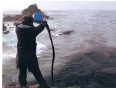
Karmelo Bermejo Aportación de fuel a la Costa Da Morte , 2005