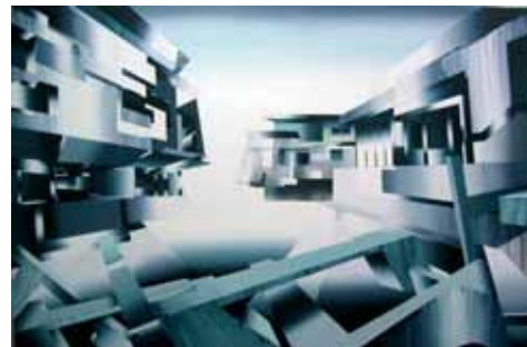
Héctor Orruño Tres poderes , 2006