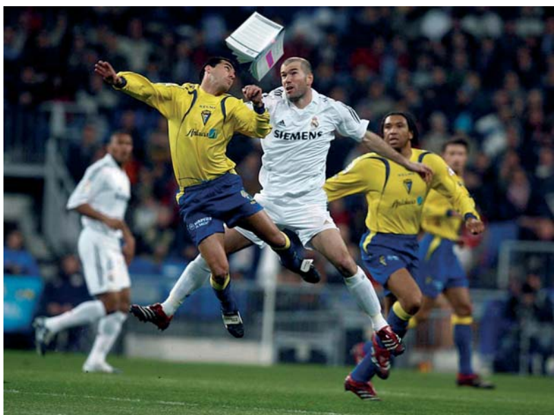
En juego, 2006