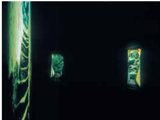
MONTSERRAT SOTO, Izenik gabe/Sin título. Video viento 1, 2, 3. 2003