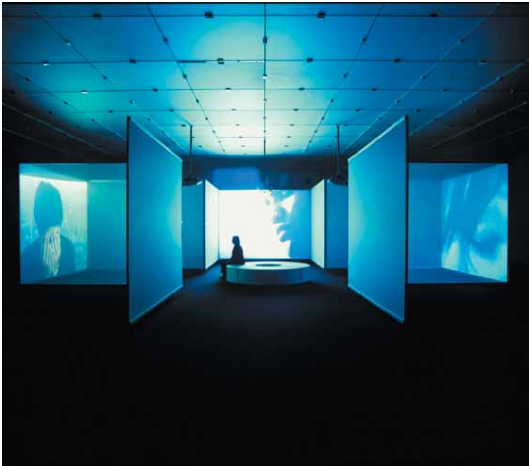
DOUG AITKEN, Interiors (Installation) , 2002