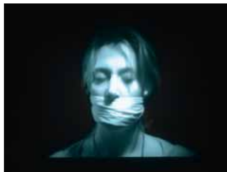
BILL VIOLA, Hall of Whispers. 1995. Xehetasuna/Detalle.