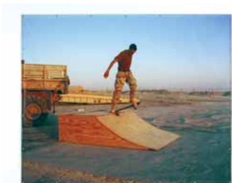
EL PERRO, Skating Irak (serie Democracia seriea). 2005