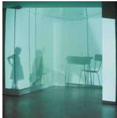
EULÀLIA VALLDOSERA, Habitación. 1996