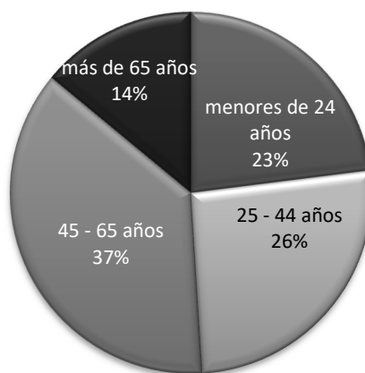
Edad de las y los visitantes 2022

De manera general, indicar cómo las usuarias y usuarios con edades comprendidas entre los 25 y los 44 años que representan el 26% de las visitas y el tramo de 45 a 65 años con un 37%, continúan manteniendo su peso específico.