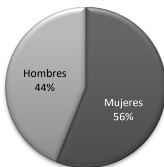
Género de las y los visitantes 2022

Respecto al género, se mantiene el equilibrio siempre superado en torno al 5% por las mujeres.