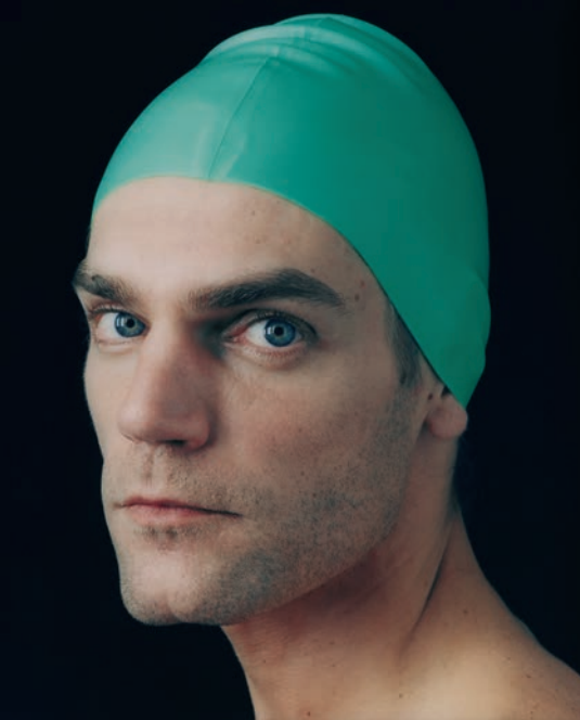
Pierre Gonnord Pia I , 1999. Colección Artium de Álava

sociales e históricos y una buena parte de nuestros artistas se han ocupado de incorporar el proceso de descomposición de esa realidad desahogada, exponiendo aquello que en este discurso era excluido o reprimido y que ha desembocado en el contexto de la crisis actual.