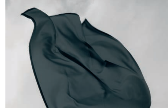
Asier Mendizabal Sin título . 2007. Colección Artium de Álava

queda modulada por un objeto arte, planteándonos cuestiones sobre la percepción espacial y temporal, y nuestra relación en él. Este tipo de conexiones entre realidad, producción del objeto artístico y su experimentación en alternativa a nuestro propio imaginario se repite en varias de las obras ubicadas en este contexto. Bajo esta lógica y a través de técnicas como el ensamblage se presentan las propuestas de Ulrich Vogl , Fran Meana , Jessica Stockholder y Haroon Mirza . Piezas que junto con las instalaciones fotográficas de Gonzalo Lebrija y Mauro Vallejo interpretan la tradición de la modernidad al tiempo que configuran un importante retorno a la seducción. A modo de epílogo, el vídeo de Shoja Azari , y las obras de Iñigo Royo y Anri Sala , elaboran mensajes sencillos desde una total falta de artificiosidad que, abiertos al accidente, invitan a reflexionar sobre la posibilidad de volver a una dimensión humana, de compromiso y dignidad como forma de gestión de la incertidumbre contemporánea.