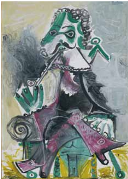
Pablo PICASSO: Mousquetaire à la pipe