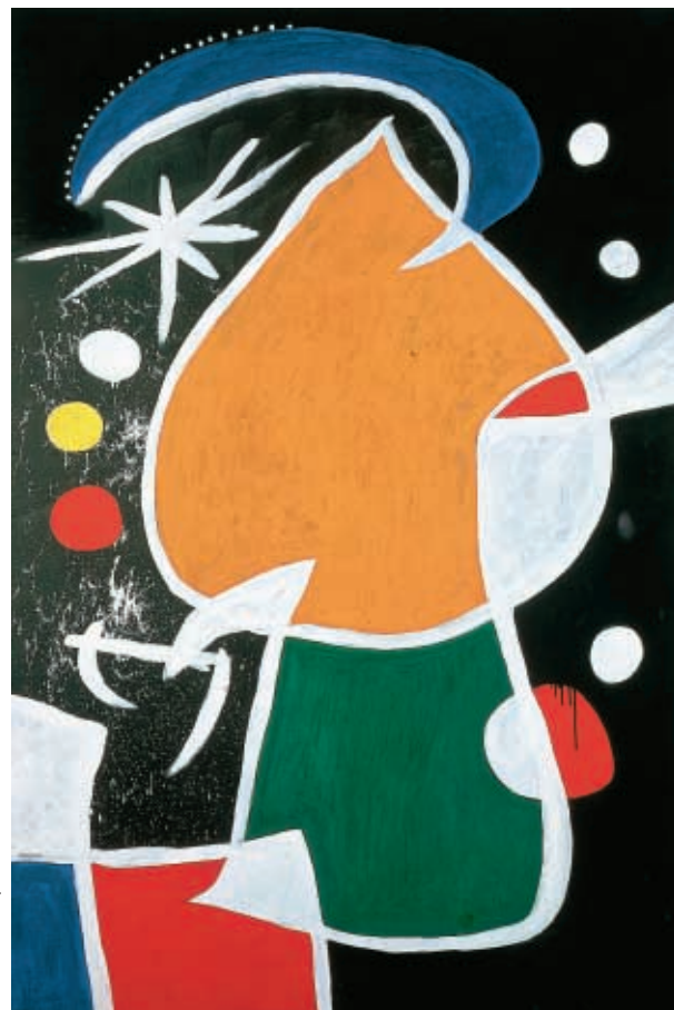
JOAN MIRO: Femme dans la nuit , 1974.