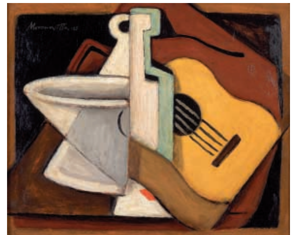
JOSE MORENO VILLA: Composición cubista , 1925.

Complementariamente, se ha preparado otra exposición fuera de los propios límites de ARTIUM titulada Gótico... pero exótico , de la que se puede obtener una información más detallada en su propio desplegable, en la que se han incluido más de una cincuenta de obras de la colección, organizada según parámetros de contraste de lenguajes y significados, que también será una oportunidad de acercamiento al importante conjunto patrimonial cedido a ARTIUM.