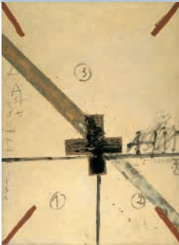
ANTONI TÀPIES: Creu negra i diagonal , 1973.

sumará a las clásicas funciones museísticas. Pretendemos aportar, desde su Colección, interpretaciones y propuestas que no son de manera exclusiva las meramente objetivas y descriptivas sino otras que permitan el debate y la discusión argumentada, su inserción real en la sociedad y la contribución a su desarrollo.