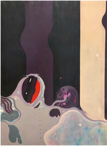
Rafael Lafuente. Figuras en su decorado . 1969

Atzealde baten gainean figura bat dagoen artean, errepresentazioa egongo da. (Alberto Molemborg)