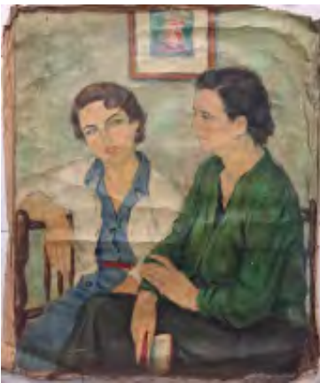
Mihisearen aurrealdea eta atzealdea. 1952

Errepikaezina denez, orainaldi bakoitzak bere aurrekoen eta ondorengoan latentzia dauka bere baitan sail suspentsibo batean, zeinetan ez baitu axolarik ez jatorriak ez norakoak, sailaren jarraitutasunak baizik. Amaituta dagoen orduko, continuum bat da artistaren obra. Ez bere karreran zehar eutsitako homogeneotasun bat baieztatzen duelako, aitzitik, obren arteko eten txiki edo handi guztiak sekuentzia bakarraren zehaztapen gisa agertzen direlako, zeinaren partaide baitira modu berean alde zurretikako obrak eta geroztikako obrak: umetako zirrimarra hasiberritik obra amaitugabeetara, eta formakuntza-garaiko zirriborro guztiak, aurrekoen esplorazioa, errepresentazio-saiakerak, lilurazko duda-mudak, estilo-deliberamenduak, finkatze-garapenak, sendotzeak, orientazio-aldaerak, eboluzioak eta mutazioak, birak, errefluentziak, baieztapenak eta birbaieztapenak, obra erabakigarriak, kritikak, orainaldia antzematea, etorkizunaren sena. Lan-bizitza batean oso corpus ugaria osatzen du horrek. Obra horietako bakoitzak bere ikuslea hautatuko du. Beraz, bada, obrek aitortza publikoaren unibertso zalantzazkoan izango duten norakoaz eta gustuaren