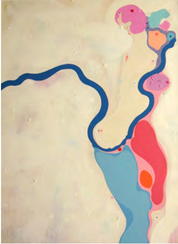
Rafael Lafuente. Figura atrapada en un jardín. 1969