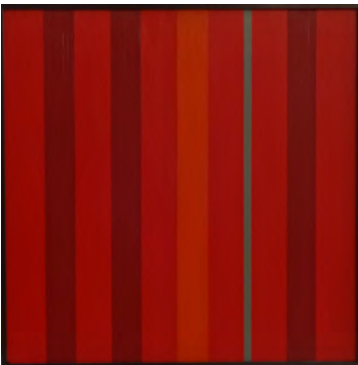
Rafael Lafuente. Pintura . 1976

Hala, irudizko adierazpenik eza nagikeriaren hain zuzen ere kontrakoa da. Borondatezko adierazpenik ezaren diskurtsoa obren adierazgarritasun leunaren kontradiskurtsoa balitz bezala, berez. Aditzera eman nahi den guztia adierazi-