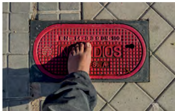
③⑦ IN_DIOS, 2025 Argazkia 60 × 38 cm