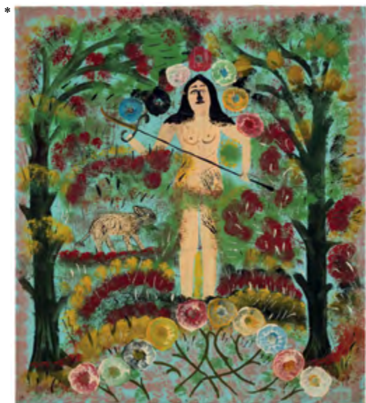
③⑤* IZENBURURIK GABEA (I), 1945 Olioa kartoiaren gainean 71,5 × 64,5 cm